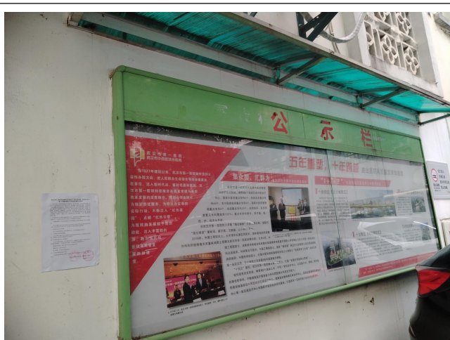
武汉市中西医结合医院（武汉市第一医院）公示栏公开照片