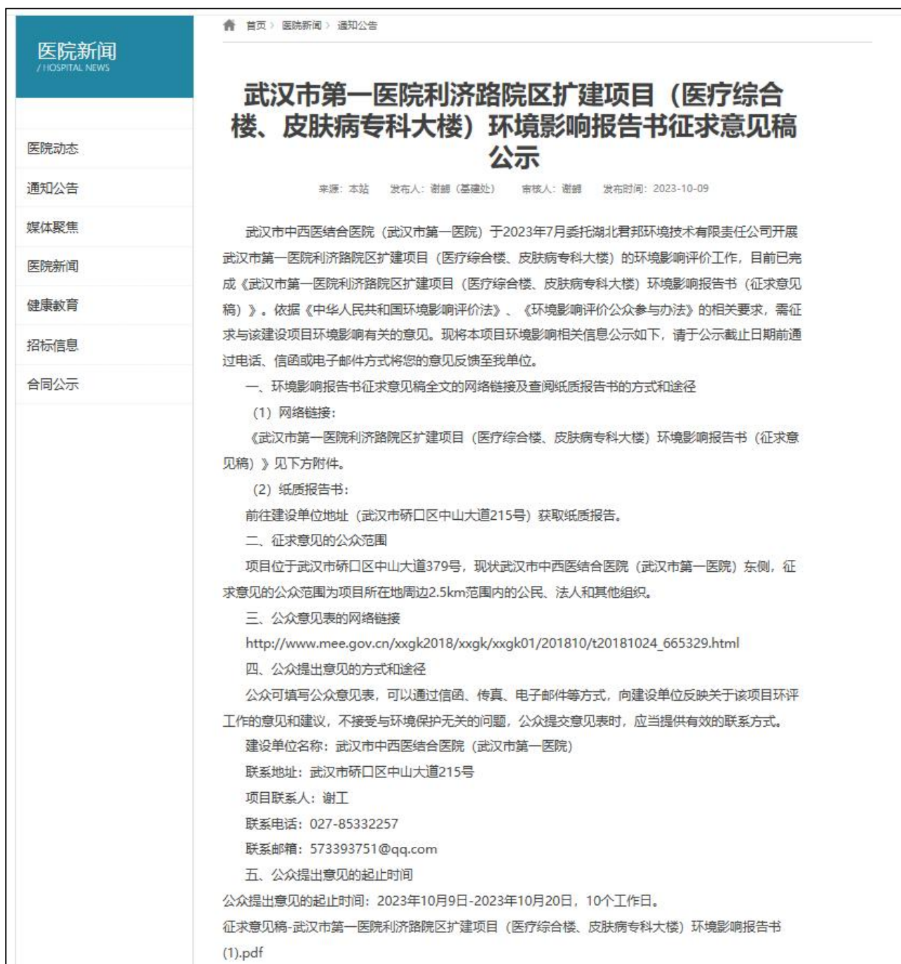
图 2 项目征求意见稿网络公示截图