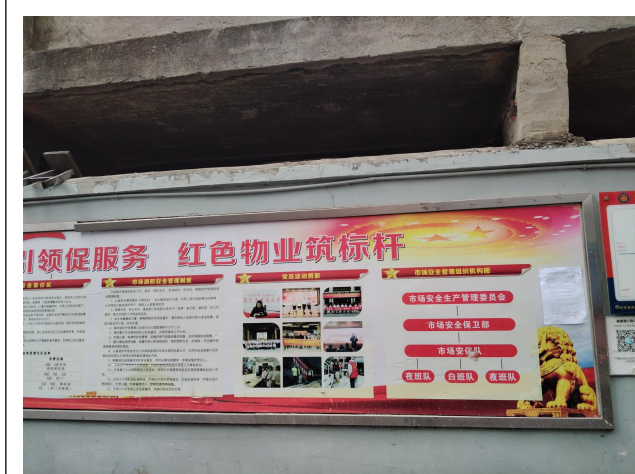
游艺社区宣传栏公开照片