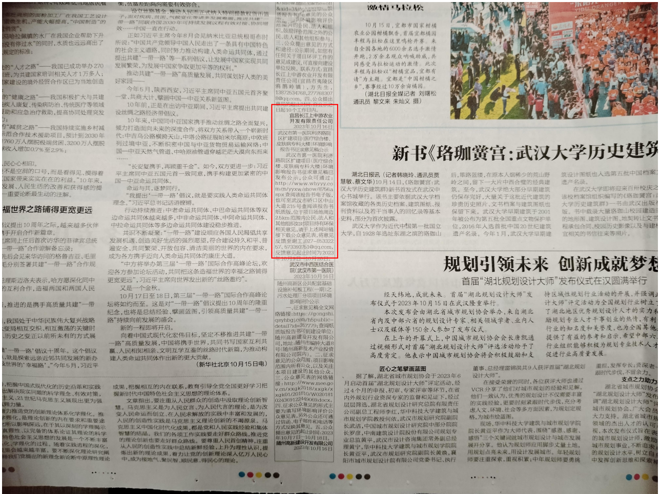
图4 2023年10月16日第二次纸媒公示截图