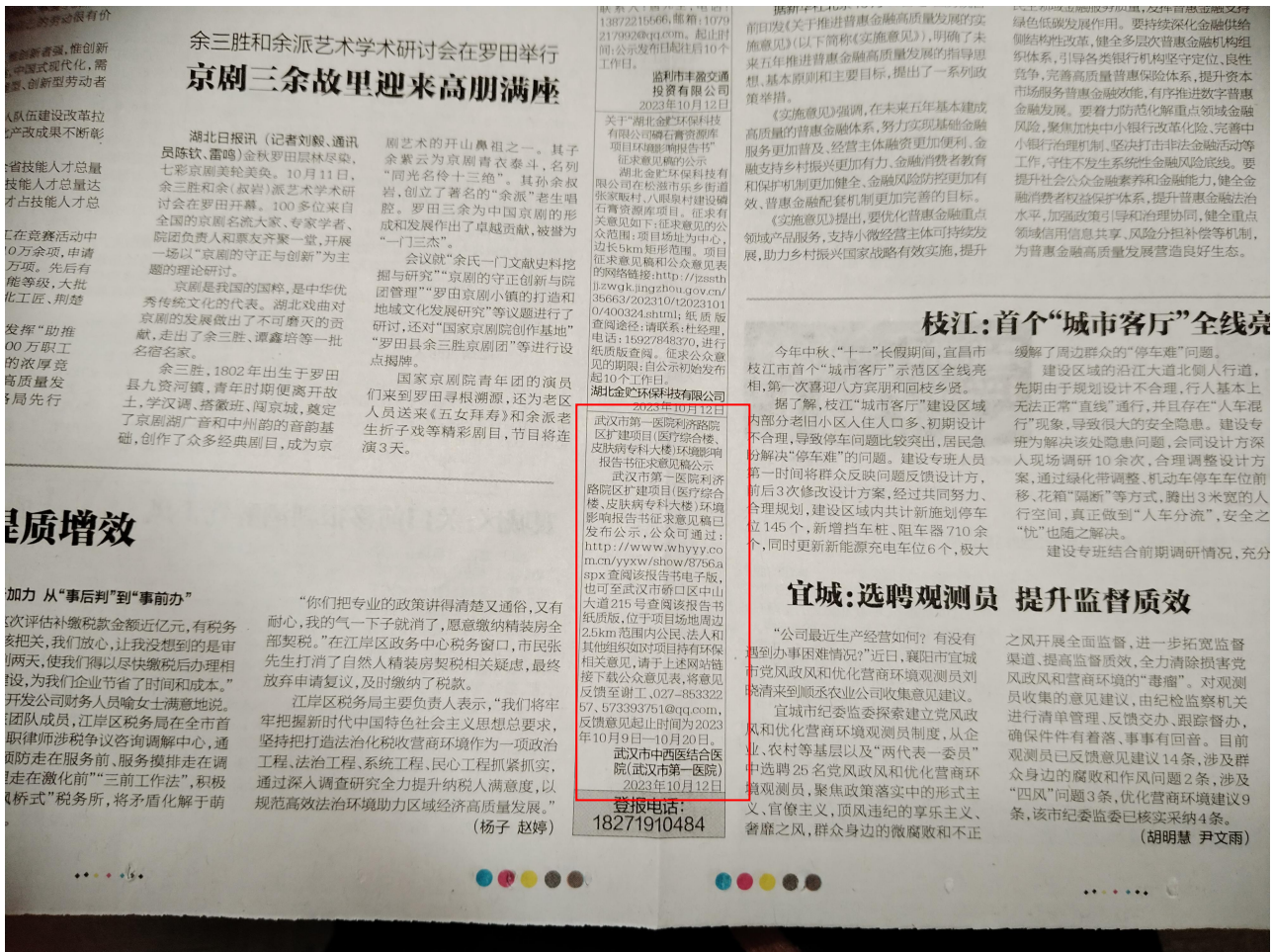
图3 2023年10月12日第一次纸媒公示截图