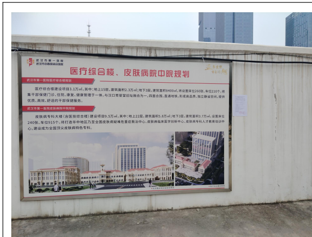
项目场地处信息公开照片