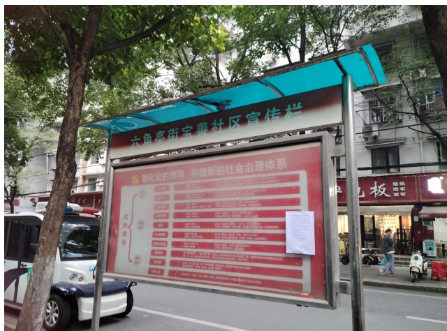
宝善社区宣传栏公开照片