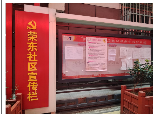
荣东社区宣传栏公开照片